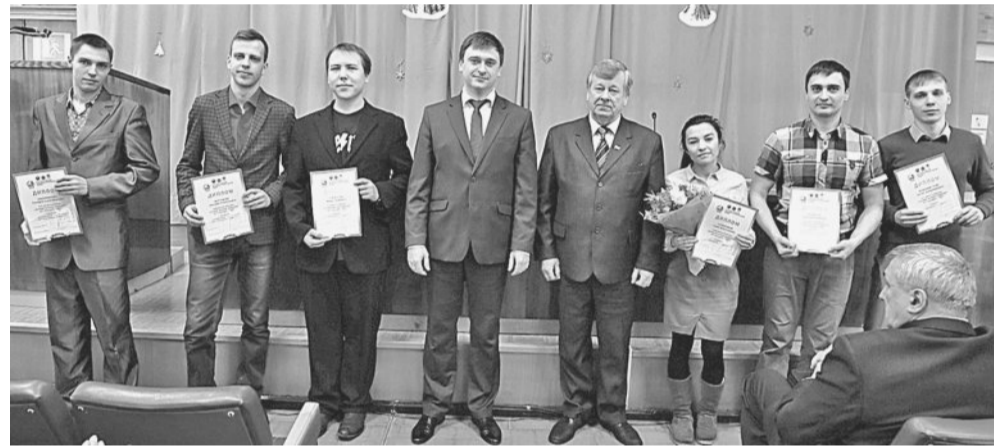
ЗАСЛУЖЕННАЯ НАГРАДА. Победителей и призёров конкурса наградили на торжественном итоговом собрании.