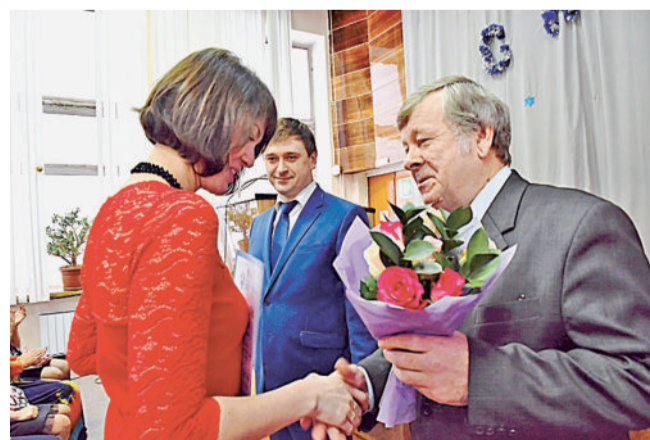
ИДЁТ ЦЕРЕМОНИЯ НАГРАЖДЕНИЯ.

Благодарим за работу и желаем дальнейших успехов!