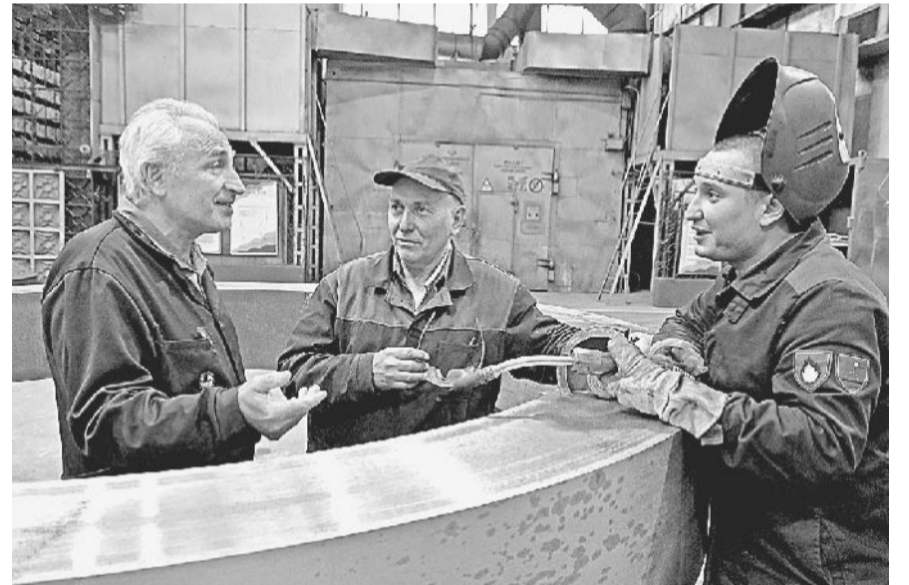
ОБСУДИТЬ, НАЙТИ РЕШЕНИЕ, СДЕЛАТЬ.

Применяемые для производства оснастки технологии и инструмент не являются для нашего предприятия новыми, но используемое для этого оборудование уникально для современных машиностроительных производств в Российской Федерации и представляет особую ценность для АО «Златмаш».